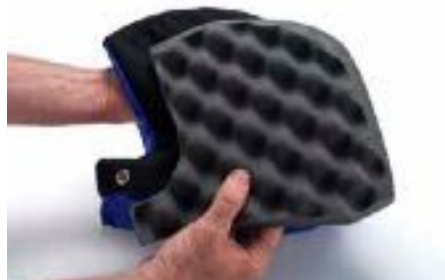
左侧和右侧泡沫的“蛋托”面一般是面向外对着头盔壳体