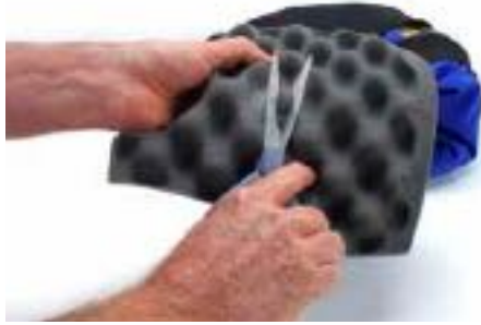
侧面泡沫上未开耳机孔，如果需要可以裁剪开孔