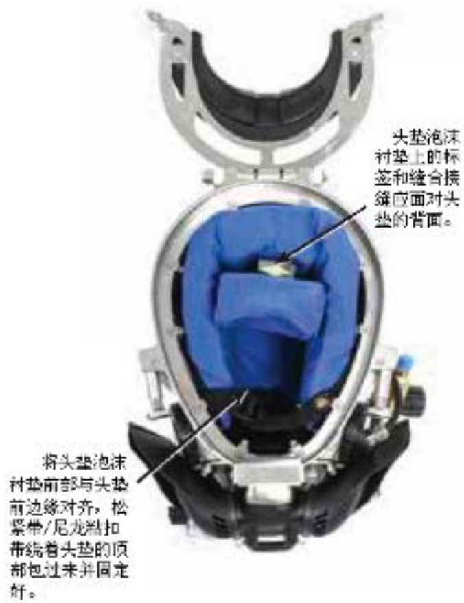
头盔内正确安装并调整好的头垫泡沫衬垫