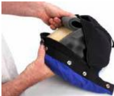
颈部垫块可以放在顶部泡沫的另一面，对着颈部或对着头盔壳体