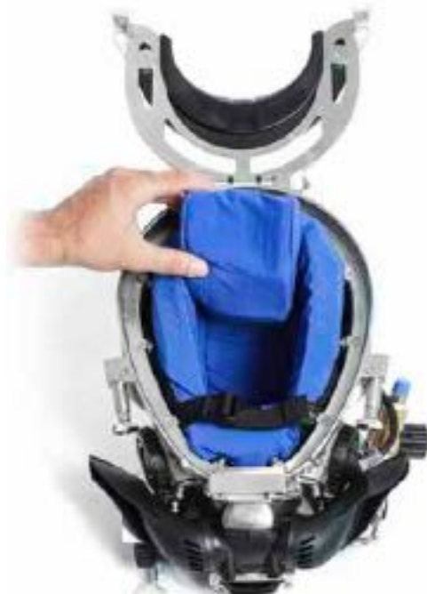
佩戴头盔时朝向头盔后面提起头垫泡沫衬垫